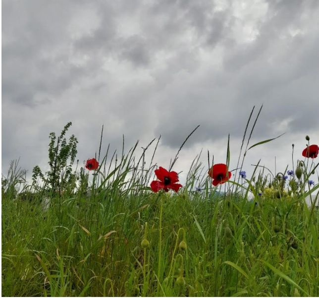
Natuur langs de snelweg.

Waar vind je God? In de ontmoeting met anderen, In de hemel en in mijn hart. God vindt ons, en vaak onverwacht In kerk, muziek, natuur In leven en dood In gebed