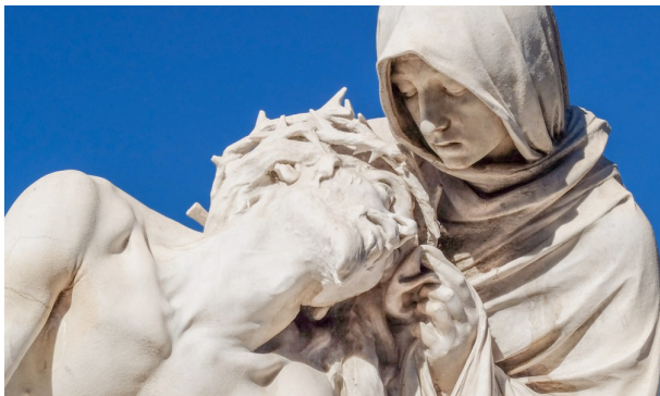
Pietà van Louis Botinelli, basiliek van het Heilige Hart in Marseille

Heilige Geest, Trooster, wees in de wereld, woon in mensen, geef ons de warmte waarmee wij elkaar nabij kunnen zijn, tot troost en sterkte.