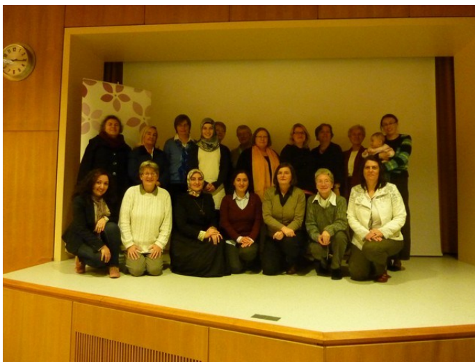
Moslimvrouwen en lutherse vrouwen

De vrouwen zijn leden van de vereniging StuFem (Stuttgarter Femina e.V.) die in 2012 is opgericht door voornamelijk Duits-Turkse vrouwelijke academici. De doelstelling is een vreedzaam samenleven van mensen uit verschillende culturen, godsdiensten en nationaliteiten te bevorderen alsmede de dialoog tussen de geslachten in het algemeen en vrouwen in het bijzonder, teneinde vooroordelen en intolerantie weg te nemen. Het is voor alle vrouwen een onvergetelijke ontmoeting die ons doet stilstaan bij onze gezamenlijke verantwoordelijkheid en de gemeenschappelijke weg die wij als zusters mogen gaan.